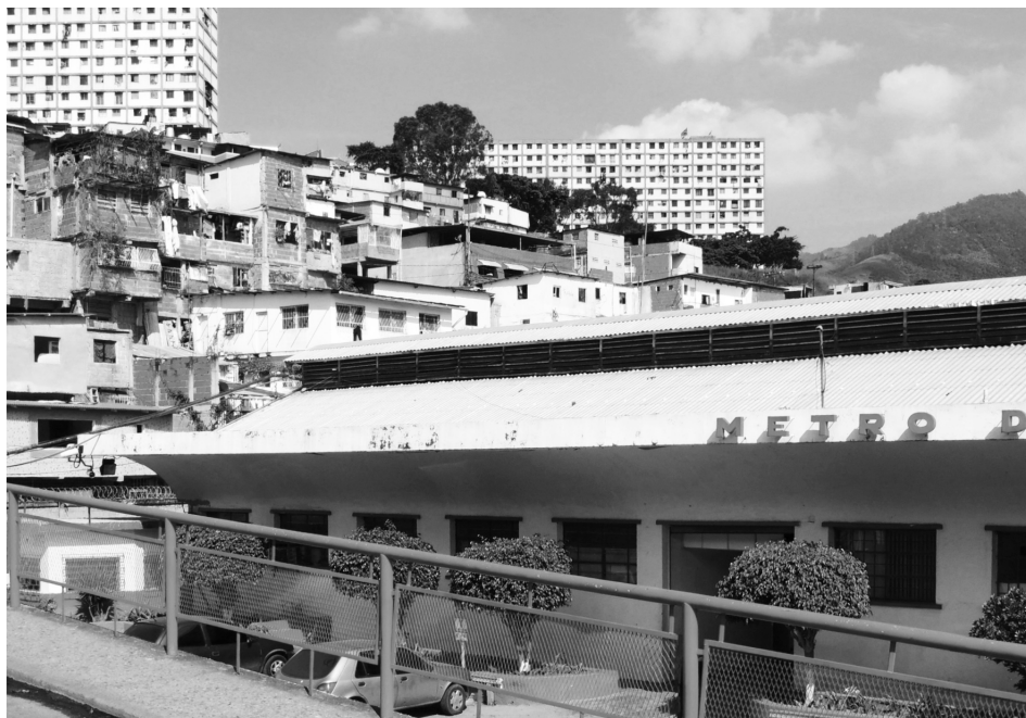
Figura 9. Caracas desde cerca. Barrio 23 de Enero