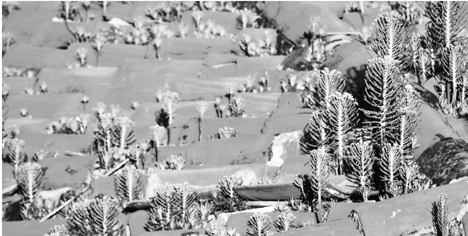
Figura 14. La vegetación que surge por sí sola en cada rincón. Los Chaguaramos, Caracas

está el norte? Esta era la primera pregunta que Carlos Raúl Villanueva, con ese tono de voz suyo, entre ingenuo y burlón, le planteaba a sus estudiantes. Quienes lo acompañábamos en las correcciones de la Facultad de Arquitectura conocían muy bien el significado de esa pregunta. Era la pregunta por el contexto, por el clima, por la inclinación del sol, por las brisas y las lluvias, por la orientación y por las vistas, por la temperatura, por la geografía y la cosmografía” (POSANI, 1994: 53). Sabiduría que deja poco lugar a la duda, la arquitectura que crece distanciada de esta cúpula tropical está condenada a convertirse en esclava de la propia tecnología que la hizo posible.