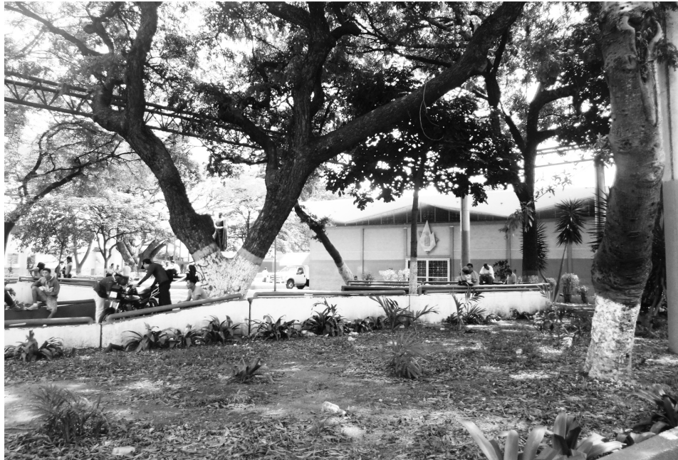
Figura 15. El vacío en la ciudad como oportunidad para la vegetación. La Vega, Caracas

Existe la necesidad por atender la pequeña escala. Preocuparse por el habitar diario de la ciudad significa atender lo que está entre construcciones, evitar el aislamiento y la división. “Si ello se consigue, dejará de ser la calle una simple franja de asfalto bordeada de aceras. Podrá ser considerada como algo asociado a los edificios y producir, por medio de cambio de niveles, de escalas, de texturas y de general adecuación, un saludable efecto de sociabilidad y homogeneidad” (CULLEN, 1974: 128). Superar la condición neutral del espacio público para transformarlo en un lugar para el consumo social, para ser interpretado, admirado y disfrutado como si fuera un parque de diversiones (KOSTOFF, 1999). Para ello será necesario brindarle oportunidades a la ciudad, que los espacios públicos no se conviertan en la excepción, sino la regla que colonice los intersticios de la indiferencia.