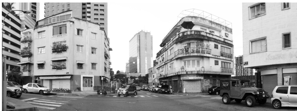
Figura 10. Caracas desde cerca. Urbanización Bolívar de Chacao