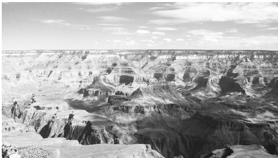
Figura 3. Representación de la noción de paisaje. Gran Cañón, EE. UU.

En términos muy generales, es entendido como una extensión de terreno que se ve desde un sitio (DRAE, 2001), definición en la que se pueden reconocer dos ideas básicas: se aprehende a través del sentido de la vista y está asociado a la distancia; se entiende además como un espacio que no se habita (figura 3). “La visión más evidente del paisaje es visual, estética, subjetiva e individual, y se entiende que el uso del concepto fue desarrollado y utilizado como una categoría entendida bajo la perspectiva del manejo del espacio” (AGUILAR BELLAMY, 2006: 7). Al estar asociado intrínsecamente a la percepción de un sujeto, ya se abre un abanico de interpretaciones, y su aprehensión por medio del sentido de la vista sugiere una estrecha relación con el espacio físico.