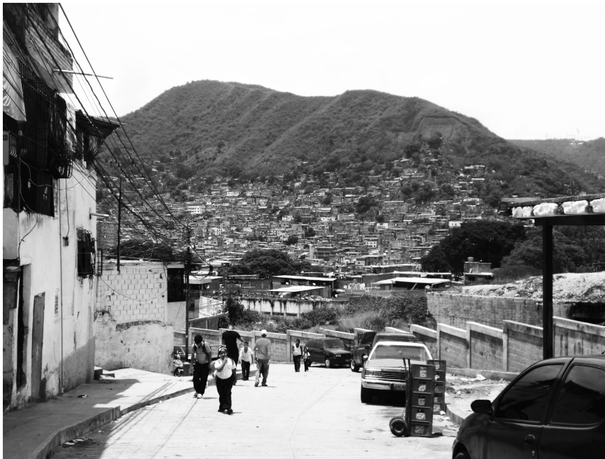
Figura 16. El paisaje urbano de Caracas como consecuencia del accionar de todos. Antímano

Las actuales condiciones del paisaje urbano tienen una responsabilidad compartida (figura 16). Si el paisaje urbano es el resultado de la interacción de sus componentes a través del tiempo, entonces todos —naturaleza, edificaciones, habitantes— han contribuido en el producto final. En primer lugar, las edificaciones se suelen instalar de manera independiente, poco vinculadas con su contexto, y caen fácilmente en una serie de piezas aisladas. Interactuar con el vacío implica considerar al edificio como incrustaciones hechas en un material, en lugar de un mueble colocado sobre una superficie (RUBY; RUBY, 2006). En segundo lugar, los habitantes han optado por estrategias individualistas: cada quien busca salvaguardar su posición desprestigiando el enriquecimiento colectivo. Por último, cuando se contrastan los temas, la legislación urbana asoma su cuota de responsabilidad. Al fin y al cabo, no ha existido una legislación y fiscalización que se preocupe por los temas aquí tratados con relación al paisaje de la ciudad.