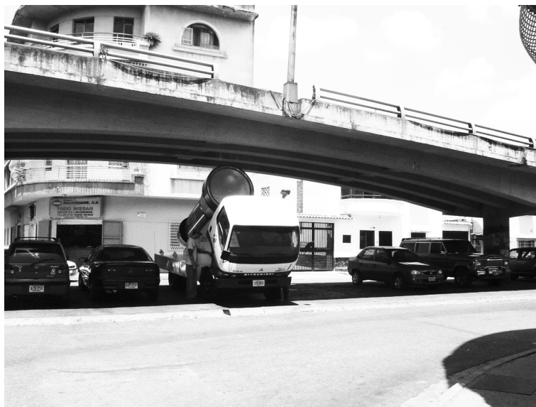
Figura 11. Elevado como espacio intersticial. Santa Mónica, Caracas

Al obviar esta condición, la especial atención que la arquitectura le brinda a las edificaciones suele traducirse en el descuido de la articulación entre ellas. “Cuando pensamos en el espacio, sólo miramos sus contenedores. Como si el propio espacio fuese invisible, toda la teoría para la producción de espacio se basa en una preocupación obsesiva por lo opuesto: la masa y los objetos, es decir, la arquitectura. Los arquitectos nunca pudieron explicar el espacio; el ‘espacio basura’ es nuestro castigo por sus confusiones” (KOOLHAAS, 2007: 9). En Caracas esta situación cobra fuerza en las llamadas Áreas de Crecimiento por Extensión , donde las manzanas no son cerradas y predominan las edificaciones aisladas (MARCANO, 1994). Al estar separadas, las construcciones tienen la oportunidad de alzarse en un completo desentendimiento del resto, el margen vacío entre unas y otras se utiliza como espacio de maniobra para absorber las diferencias y tiende a adquirir condiciones residuales. Estas situaciones se multiplican a lo largo de la ciudad convirtiendo muchos de estos vacíos en espacios intersticiales, los cuales suelen carecer de noción de lugar, presentarse como una incertidumbre para quien los recorre, ser indefinidos y comúnmente ocupados por lo anárquico (VON DER HEYDE, 2007) (figuras 11 y 12).