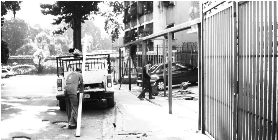
Figura 1. Materialización de los linderos en Caracas a través de rejas y muros

En los últimos años, el autor ha desarrollado un trabajo de investigación que analiza y se adentra en el estudio de la noción de límite en el ámbito de la arquitectura y el diseño urbano. El límite que, con referencia a las múltiples escalas y situaciones posibles, se presenta en forma de linderos, límites de propiedad que definen los lotes o parcelas, y que en algunos casos han ido tomando cuerpo con el paso del tiempo. En ciudades como Caracas, donde, a raíz de una galopante inseguridad, el propietario ha ido construyendo rejas y muros en los bordes de su respectiva parcela, cortando, o al menos dificultando, las relaciones entre el ámbito privado y el público (figura 1). Aunque esta situación es de suma importancia, la materialización de estos límites ha tenido otras consecuencias de peso: la anárquica intervención de la ciudad con planos que tienden a la verticalidad, una intensa fragmentación y un marcado deterioro del paisaje urbano (término sobre el cual se profundiza más adelante en este trabajo). En la tarea de desarrollar este último punto, el problema ha adquirido significación propia y se ha traído a debate por medio del presente texto.