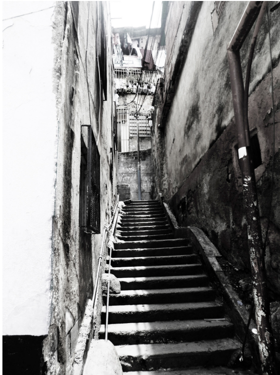
Figura 12. Escaleras como uno de los pocos espacios públicos en los barrios de Caracas. La Vega

Las faltas asociadas al vacío en el paisaje urbano caraqueño no son solo cualitativas, las debilidades cuantitativas son alarmantes. “Caracas cuenta sólo con 1,5 m 2 de áreas verdes/hab. No existen condiciones para la movilidad peatonal (aceras amplias, iluminadas, limpias, con paradas de transporte público) y los sectores de barrios (donde vive una alta proporción de la población) no tienen ningún tipo de espacio público” (ALCALDÍA DEL ÁREA METROPOLITANA DE CARACAS, 2011). Seguramente sea exagerado decir que no existe ningún tipo de espacio público en las zonas de barrios porque incluso las escaleras se convierten en punto de encuentro; pero igualmente los índices son alarmantes (figura 12).