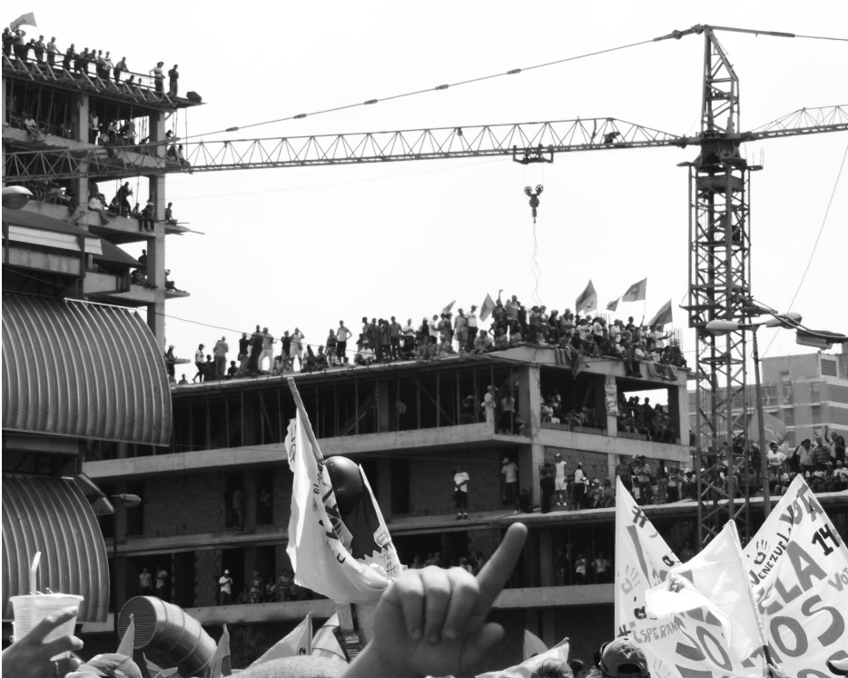
Figura 4. El paisaje urbano en constante transformación

A partir de estas consideraciones, se han seleccionado algunos puntos especialmente resalantes, sobre todo cuando se considera el caso de estudio: la relación de escala, la condición de vacío y la presencia del ámbito natural. Estos puntos se presentan con fuerza al final del ensayo de EDUARD BRU (1997: 26) titulado La mirada larga , que utiliza para introducir la exposición Nuevos paisajes. Nuevos territorios , del cual se extrae el siguiente segmento: