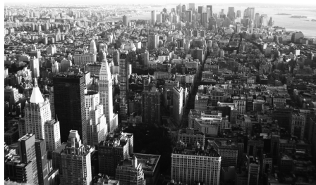
Figura 6. Paisaje-Urbano desde cerca. Budapest, Hungría